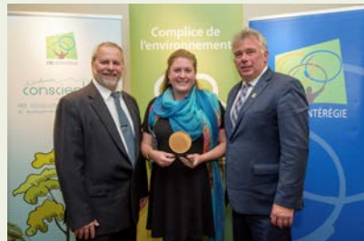
Mouvement écologique du Comté de Richelieu