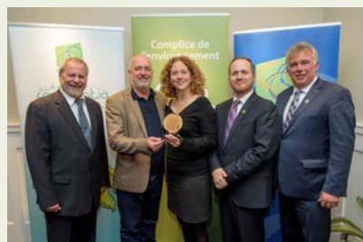
Centre de la nature de Mont-St-Hilaire et Ville du Mont-Saint-Hilaire