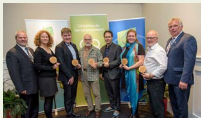
Félicitations aux lauréats