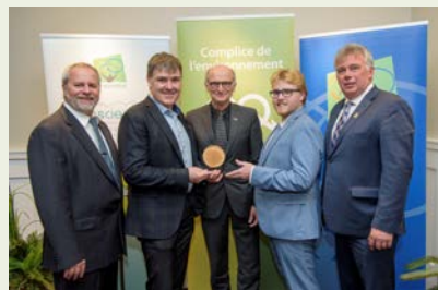
Ville de Longueuil